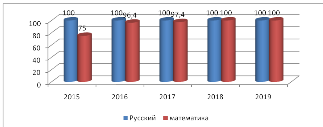
Диаграмма результатов ЕГЭ по основным предметам в разрезе 5 лет